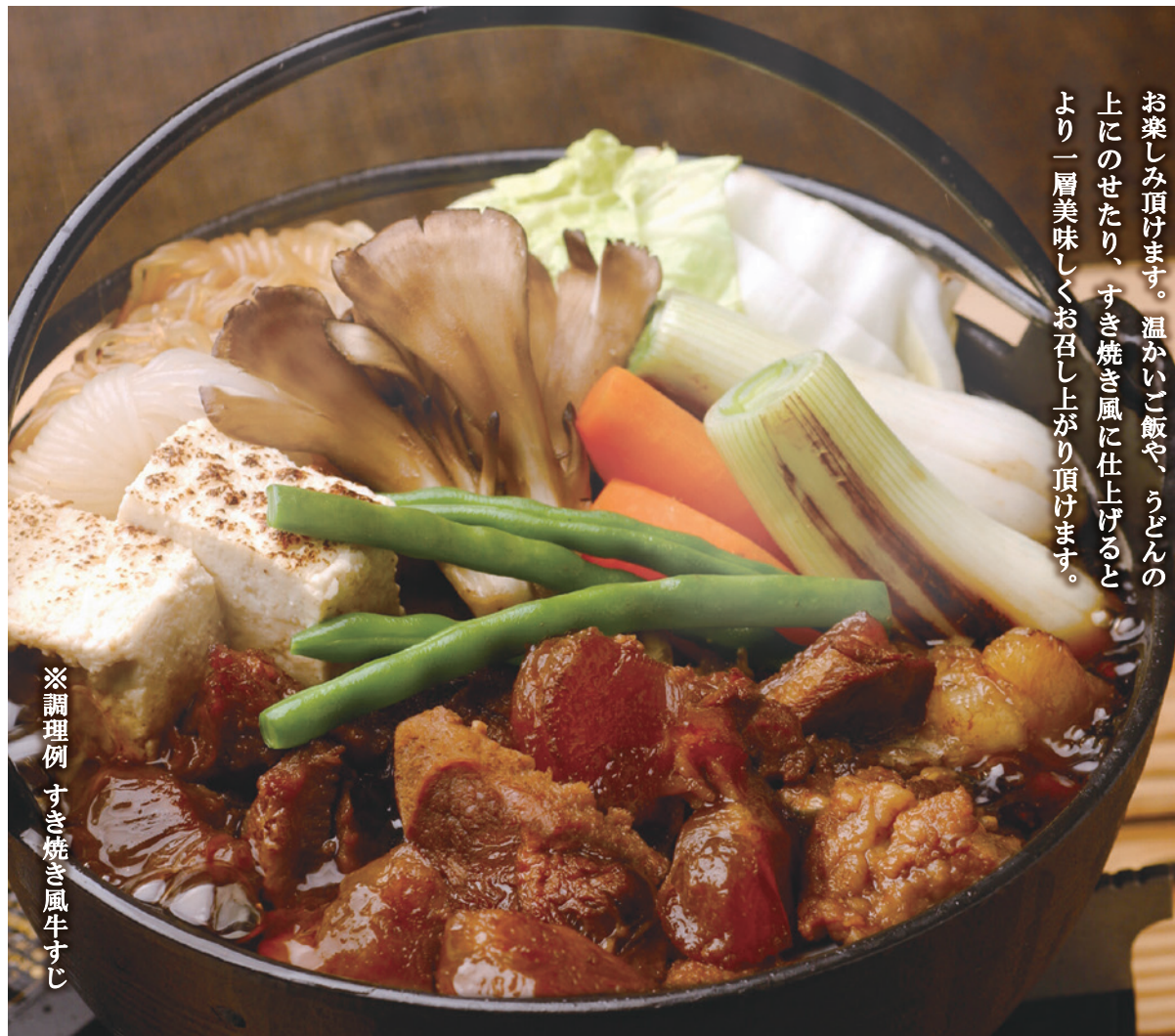
※調理例 すき焼き風牛すじ

国産牛すじ肉をじっくりと柔らかく煮込みました。濃厚な味わいをご家庭でも簡単にお楽しみ頂けます。温かいご飯や、うどんの上のせたり、すき焼き風に仕上げるとより一層美味しくお召し上がり頂けます。